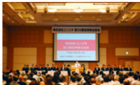
定時株主総会の様子

また、ご来場いただいた株主様には、自然災害への備えとして、「防災セット」をお渡ししました。