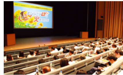
ビッグデータをテーマに「システム管理者感謝の日イベント」を開催

「システム管理者の会」では、エンジニア魂をもつ方が生き生きと働き、会社や社会に貢献できる裾野の広い活動の場と、