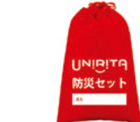
株主様向けお土産「防災セット」